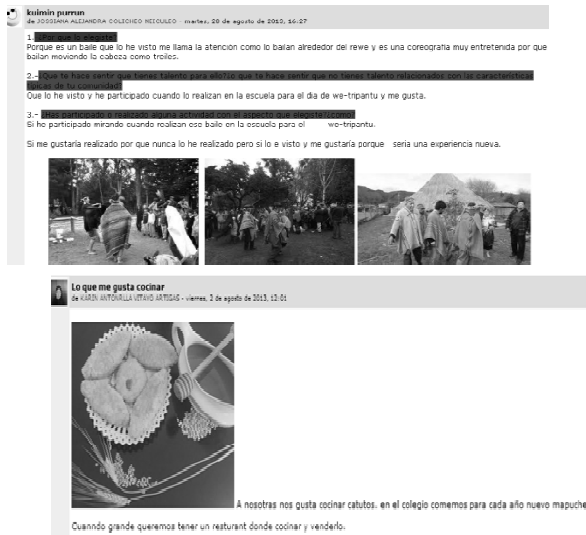
Figura 2: Ejemplos de Gestión de Talentos en Plataforma Comunidades Virtuales