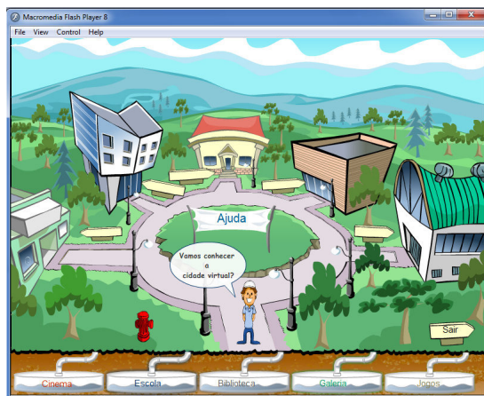
Figura 1 – Campus virtual Hidrolândia e o Prof. Hidro.