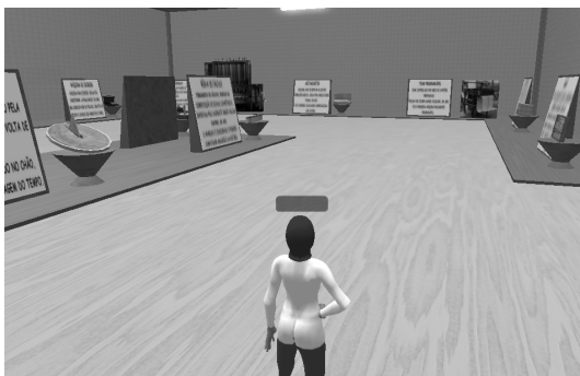
Figura 2. Galeria da Pré-História da Computação.

O Museu da História da Computação apresentado neste trabalho traz a proposta de inserir o estudante em um museu virtual para auxiliar no ensino-aprendizagem nas disciplinas de introdução à computação dos cursos da área. A colaboração e os objetos interativos trazem ao aluno um ambiente mais atrativo, aumentando a sua atenção durante a visita virtual. A estrutura do museu está em dividida em um hall de entrada, quatro galerias de exposições e duas salas. No hall de entrada, o estudante tem acesso a um mapa do museu para orientar-se e a um ambiente para a visualização de um vídeo introdutório sobre o museu, apresentando sua estrutura e suas principais atrações. A primeira galeria (figura 1) do museu é referente à pré-história da computação, onde encontram-se vários objetos de diferentes tempos, que representam as primeiras invenções humanas para contagem, exibição e manipulação de números, palavras, sons e imagens.