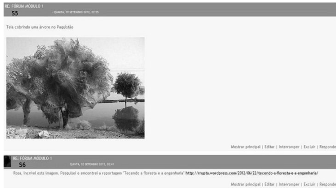
Figura 4: Exemplo de representação da Cultura da Paz para S5

O querer ser de S5 instaurou, pela sensibilidade, em que a expressão “Isso é incrível” é uma evidência, uma dimensão do poder querer e um poder-fazer em S6 (foi em busca da reportagem), pois este apreciou a imagem inserida por S5 e foi além, aprofundando o contexto social da imagem. Nesse contexto, um não querer não ser se apresenta como impossível. A atividade não foi imposta mas despertou naturalmente em meio a discussão e sentimentos, entrando em conjunção com a Cultura da Paz. Através da linguagem imagética S5 expressou seu estado de alma, envolveu a sensibilidade e produziu significados para si e para os colegas.