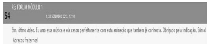
Figura 3: Exemplo de Estado de alma de S4.

Referente ao poder do discurso pedagógico ressalta-se que esse apresenta-se “[...] como a denominação de um dos predicados possíveis do enunciado modal (de fazer ou de estado), que rege um enunciado descritivo” [5] ( p. 337). Da mesma forma S2 desperta, em S4, um poder-querer assistir ao vídeo indicado. Pela escrita demonstra um “estado de alma” de vislumbramento e satisfação pelo querer-ser e pelo saber-poder-ser, quando destaca: “[...] ótimo vídeo. Eu amo essa música [...]” (Figura 3).