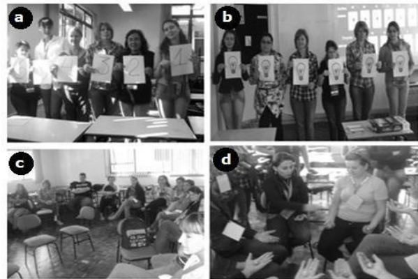
Figura 1. Aplicação da Oficina

aplicação das atividades Redes de ordenação (a), Contando os pontos (b) e Jogo da laranja (d), além dos debates finais a cada atividade (c).