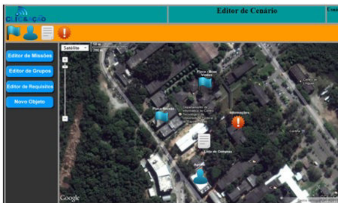
Figura 2 – Editor Colaborativo do ALRA.

Foi necessário criar no editor colaborativo (figura 2), uma estrutura para a criação da aventura. A estrutura compõem as etapas que farão parte do roteiro do aventureiro durante a recepção na universidade. Para realizar a aventura criamos três níveis de aventureiros: (i) Aprovado no vestibular é um aluno que, apesar de aprovado no vestibular, não realizou matrícula na universidade a missão dele será realizar a matrícula para isso deve pegar um formulário na reitoria com um agente. (ii) estudante já realizou a matrícula e agora vai cumprir missões para conhecer a Universidade. (iii) calouro é o último nível. Uma nova missão é aberta, que é comparecer à calourada que é aberta somente aos calouros.