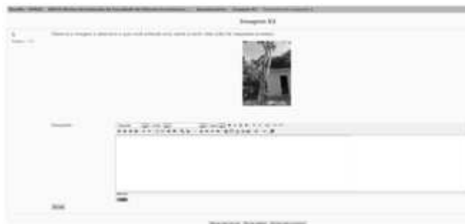
Figura 4. Tela de registro de impressões da fotografia

O recrutamento de alunos consistiu no envio do convite aos estudantes de graduação de cursos de Arquitetura e Urbanismo, da UFRGS e de outras instituições de ensino superior, bem como, de outras áreas do conhecimento. Como forma de atrair alunos, a atividade concedeu quatro horas de atividade complementar no ato de sua conclusão. Tática que reuniu ao todo 28 alunos, dois quais 24 eram alunos do curso de Arquitetura e Urbanismo da UFRGS. Dos 28 alunos ingressantes 24 concluíram a experimentação.