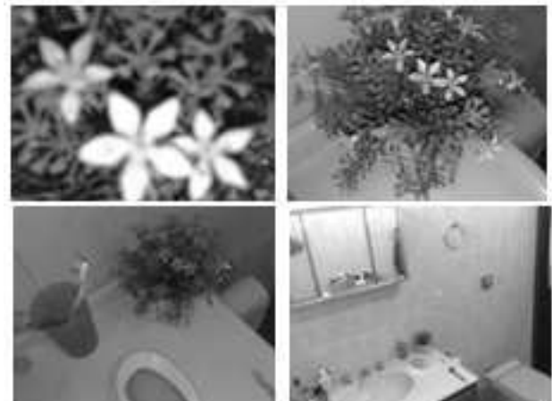
Figura 7. Conjunto de imagens terceiro ensaio

O terceiro conjunto de fotos, Figura 7, cuja provocação era baseada na proximidade dos objetos mostrados, fez, novamente, com que os participantes questionassem sua crença de realidade, desconstruída a cada nova foto revelada. Neste sentido, os relatos dos participantes coincidem com as expectativas dos pesquisadores, tendo sido poucos aqueles que tiveram sua atenção captada por outros elementos.