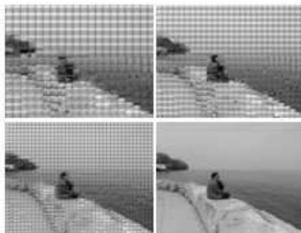
Figura 8. Conjunto de imagens terceiro ensaio

Neste sentido, ainda que em algum momento todos os participantes tenham percebido as fotos como parte de algo maior e destacado os conceitos de água, terra e mar, novas interpretações foram constantes em relação à composição da terra, variando desde a presença de areia, pedras ou grama até banhistas. A figura humana, por vezes interpretada como poluição ou construções, e a presença ou não de banhistas e animais marinhos na água também foram registrados. Para as primeiras fotos do conjunto, houve mesmo participantes que trataram cada fotografia do mosaico de maneira individual, só posteriormente percebendo-as como partes de um todo.