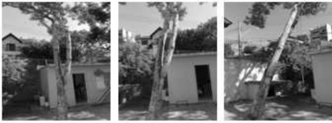
Figura 5. Conjunto de imagens primeiro ensaio

O que estes relatos demonstram é que muitos observadores detiveram sua atenção em outros elementos retratados nas fotografias que não aqueles pretendidos pelos pesquisadores. Como exemplo usou a presença de brinquedos como um indicador de crianças e citaram sensações que eram propiciadas pela imagem (uma característica que se percebe em relatos de todos os conjuntos). Registros dos aspectos do cenário associaram-se a suposições sobre o "real" a partir de detalhes observados, com foco na qualidade arquitetônica das construções e comentários quanto ao poder econômico dos prováveis moradores do ambiente visualizado. Entretanto, outros observadores registraram sensações como de tranquilidade, sensações de claustrofobia e falta de aconchego, bem como reviveram memórias da infância. Poucos, contudo, registraram a percepção da inclinação da árvore, se referindo à mudança de perspectiva quanto ao espaço (ângulos).