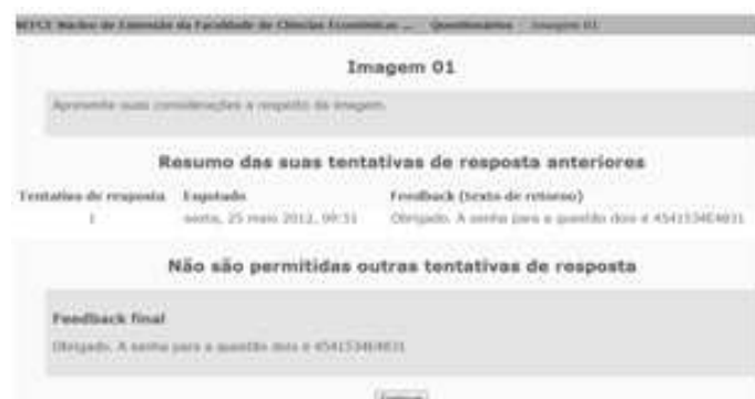
Figura 2. Registro da impressão do aluno concluído e senha de acesso para a próxima fotografia