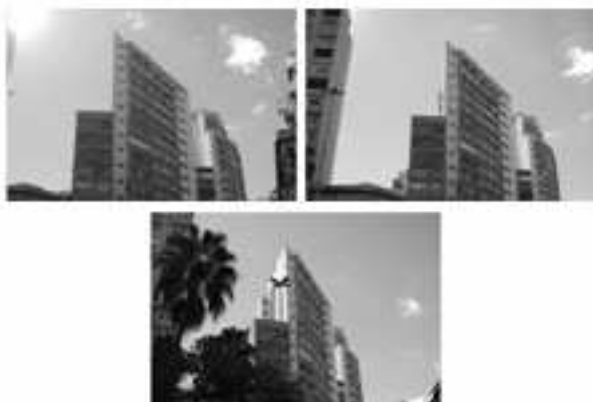
Figura 6. Conjunto de imagens segundo ensaio

Para o segundo conjunto de fotos, Figura 6, a provocação sugerida foi a ilusão causada pelo prédio do centro, que, em função do ângulo da foto, parecia não possuir uma de suas dimensões. Poucos foram os alunos que não perceberam esta provocação, o que pode ter sido influenciado pelo fato de quase todos pertencerem ao curso de arquitetura.