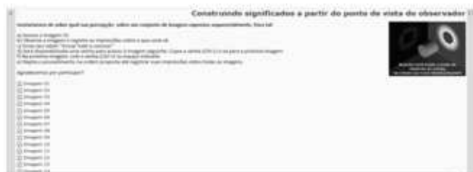
Figura 1. Tela inicial da ação de extensão no Moodle

Ainda, o registro das observações dos alunos sobre a fotografia atual era pré-requisito para liberar o acesso a fotografia seguinte, pois, lhes retornava em seu feedback a senha de acesso ao questionário com a próxima foto. As imagens da Figura 1 a Figura 4 ilustram a estrutura criada no ambiente Moodle. Com a estruturação do experimento concluída, seguiu-se a terceira etapa, iniciada com o convite a experimentação e a inclusão dos participantes. Para este propósito, foi criada uma ação de extensão do Núcleo de Extensão da Faculdade de Ciências Econômicas (NEFCE), construída através do portal da UFRGS e intitulada Construindo Significados a Partir do Ponto de Vista do Observador.