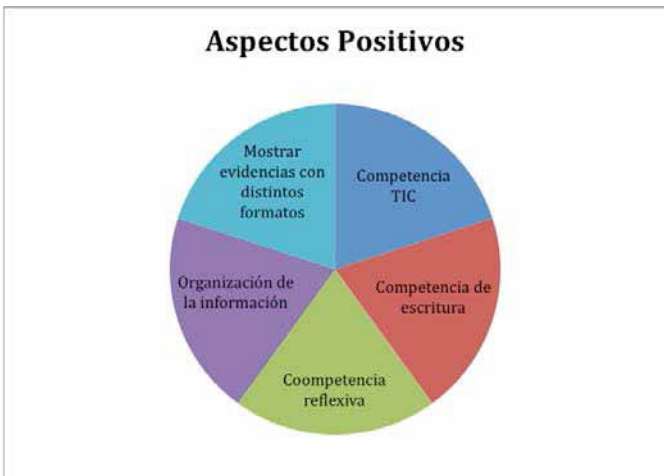
Figura 2. Representa los elementos positivos considerados por los estudiantes en el uso del portafolios digital

En general los aspectos positivos que los estudiantes señalan se vinculan con: