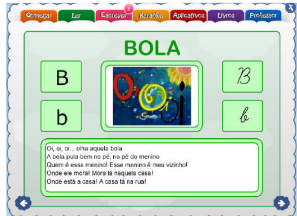
Figura 4. Essa é a imagem do layout inicial do Módulo Começar.

O Módulo Escrever possui quatro aplicativos que possibilitam a produção de três diferentes gêneros de texto: cartão postal, jornal e gibi, além de um editor de texto com suporte ao arquivamento das produções. Possui também um acervo de 37 livros digitais da categoria 1 (acervo do 1º ano com 12 livros); categoria 2 (acervo do 2º e 3º anos com 12 livros) e a categoria 3 (acervo do 4º e 5º anos com 13 livros).