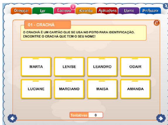
Figura 3. Essa é a imagem do layout inicial do Módulo Aprendendo a Usar o Computador.

O módulo Ler é de consolidação do processo de alfabetização, com vinte aulas contendo um mil cento e setenta e cinco atividades e jogos educativos. As aulas são baseadas em textos diversificados: músicas, biografia, receita, acróstico, dentre outros. As atividades partem da exploração do texto como todo para suas partes.