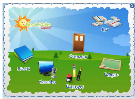
Figura 1. Essa é a imagem do layout inicial do software LSI.

O Projeto LSI é indicado como um suporte para alfabetizar as crianças que não foram alfabetizadas na idade certa, sua proposta é a alfabetização, letramento e letramento digital. Por esse sentido o Projeto está inserido no Programa de Alfabetização na Idade Certa (PAIC) que atende os municípios prioritários, ou seja que não conseguiram alfabetizar as suas crianças.