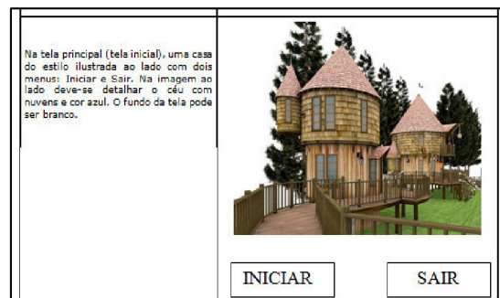
Figura 2. Tela inicial do storyboard / acervo dos autores.

Na primeira fase de concepção do OA, são definidos os objetivos e o conteúdo que se pretende ensinar com o uso do Objeto, neste caso, tem-se o objetivo de reduzir as dificuldades dos alunos na aprendizagem das operações de adição e subtração entre os inteiros. Ainda nesta fase, são projetados um design pedagógico e storyboards , que é um roteiro de telas das faces e interfaces do OA (Figura 2). Por fim, o projeto é encaminhado a uma equipe técnica para implementação do OA.