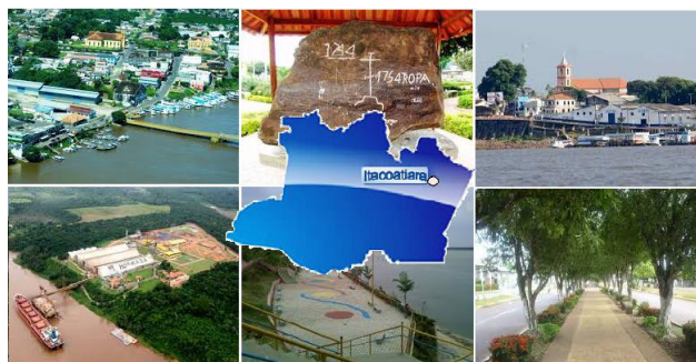
Figura 1. Cenário de realização do estudo.

acompanhamento é um dos fatores importantes para a coleta de dados do estudo.