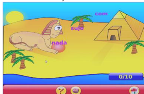
Figura 1. Reconhecimento de Letras e Formação de Palavras

Na Figura 1 apresenta uma possibilidade de aprendizagem dos conteúdos iniciais de português acerca dos reconhecimentos das letras e formação de palavras. Neste jogo as letras vão caindo na tela e o aluno deve encontrar as mesmas letras no teclado. Após o reconhecimento da letra no teclado o aluno deve digitar no teclado a letra que cai e, aos poucos, a cada letra que cai deve formar palavras. Essa atividade visa proporcionar ao aluno a habilidade reconhecimento das posições de cada letra no teclado e assim permitindo o desenvolvimento da coordenação na digitação das palavras.