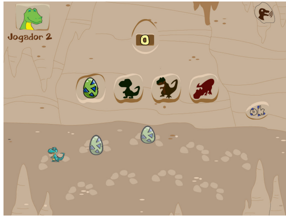
Figura 2. Tela do jogo Dinobase 1.0: compra de um novo elemento

O turno só pode ser passado ao próximo jogador, após o jogador atual utilizar todas as unidades recebidas no sorteio. Para realizar a compra, o jogador clica no ícone em relevo correspondente ao elemento desejado, como apresenta a Figura 2.