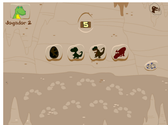
Figura 1. Tela do jogo Dinobase 1.0: sorteio de valores

Neste contexto, o jogo Dinobase 1.0 configura como um dos produtos desenvolvidos no projeto. Tem por meta a aprendizagem de potenciação e pode ser jogado de 2 a 4 jogadores com idades entre 8 e 10 anos. A partir de uma mecânica simples, o jogador precisa realizar operações de potenciação, especificamente da base 3, para poder prosseguir no jogo até atingir a meta final, que é obter a pontuação máxima, correspondente a 3^3 .