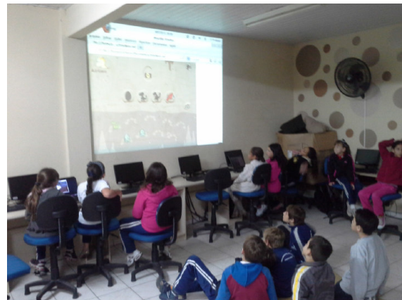
Figura 3. Alunos recebendo instruções do jogo. Fonte: [1]

conquistar cada dinossauro. Os resultados evidenciaram que os alunos obtiveram maior acerto quando realizavam as trocas diretas permitidas pelo jogo, isto é, por exemplo, quando se perguntou quantos ovos ( 3^0 ) vale um dinossauro bebê ( 3^1 ), a assertividade foi mais frequente entre os alunos. Nas trocas indiretas, os índices de acertos foram menores, por exemplo, quando se questionou quantos ovos ( 3^0 ) eram necessários para obter um dinossauro jovem ( 3^2 ). Isso demonstra uma certa dificuldade dos alunos em compreenderem os valores associados aos dinossauros e a abstração matemática necessária para a realização deste tipo de cálculo. Os resultados também evidenciaram a necessidade de intervenção do professor para incentivar o aluno a pensar sobre as jogadas e cálculos realizados, auxiliando no aprendizado [1].