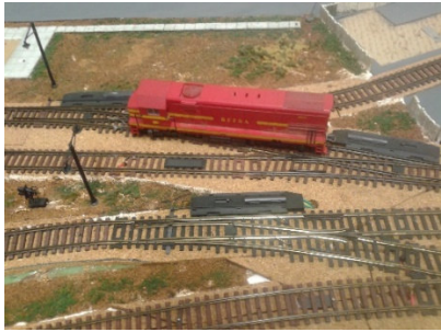
Figura 1: O LabVAD-Maquete do ferromodelismo.

aprimoramento do trabalho em equipe, viabilizando assim o seu crescimento profissional e pessoal.