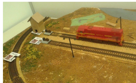
Figura 3: A “casinha de chocolate” e os três possíveis destinos.

Em resumo, nessa nova possibilidade educacional, o aluno irá inicialmente optar por um entre três possíveis destinos e colocar o artefato de papelão sobre o local escolhido e após tê-lo posicionado, ligará o sistema e observará a locomotiva, comandada pelo Arduino, percorrer os trilhos a procura da casinha de chocolate, até que ela seja encontrada. Os passos da busca são visualizados em um display digital até que no mesmo apareça a mensagem “Chocolate encontrado em .... (A, B ou C)”, momento em que a locomotiva ficará parada. Ao término do procedimento, poderá ser aberto um debate acerca da definição de inteligência entre outros temas. Em outro momento, o trabalho poderá contribuir com estudantes de outro segmento de ensino, ao permitir o exercício e teste de possíveis algoritmos de busca.