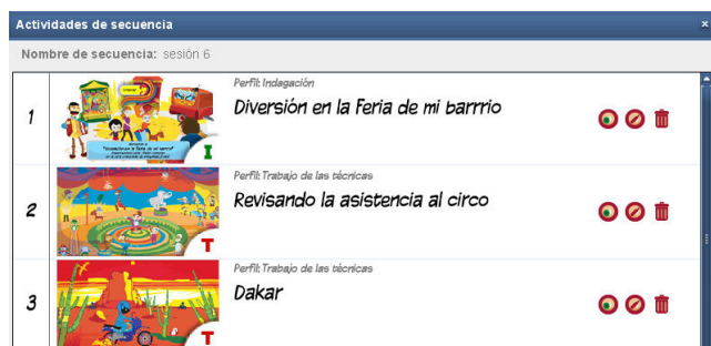
Figura 2. Listado de actividades creadas dentro de una secuencia.

A partir de las opciones iniciales escogidas para la elaboración de la secuencia, el software es capaz de proponer una gama de actividades acordes con dicha selección. Ello es posible gracias a que cada actividad está indexada en base a un conjunto de características didácticas derivadas del modelamiento del campo de problemas aditivos que se llevó a cabo como parte del proceso de investigación y desarrollo.