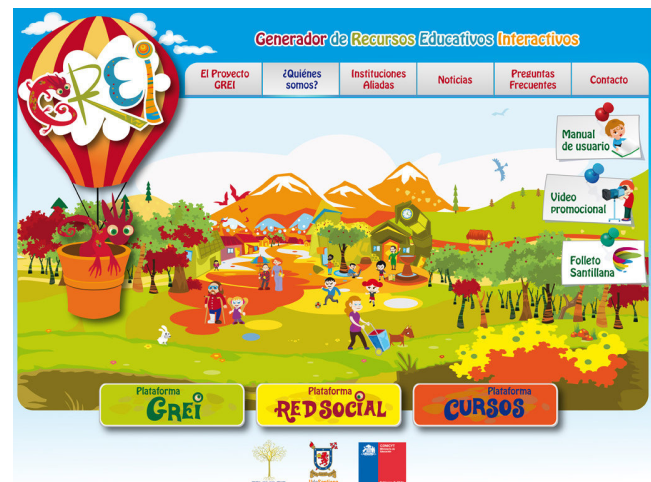
Figura 1. Página inicial del GREI

En términos didácticos, aprender matemáticas consiste esencialmente en hacer matemáticas y, por tanto, en la realización de una práctica. Aprender matemáticas comporta la realización de un proceso que sitúa en el corazón del quehacer del que aprende el estudio de problemas articulados entre sí, más allá de la sola resolución de problemas aislados y, en este sentido, consiste en "ocuparse de problemas". Este proceso de estudio está constituido por distintas dimensiones o momentos del trabajo que realizan docente y estudiantes, que van desde la exploración auténtica de problemas, a la justificación y sistematización de lo matemáticamente construido, pasando por el trabajo de