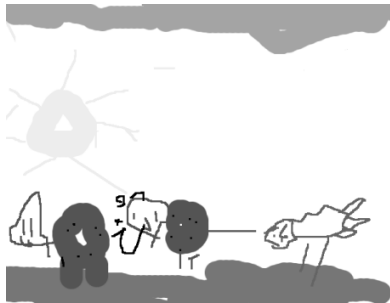
Figura 2. Dibujo realizado en la herramienta Tuxpaint por uno de los casos, a partir del cual se construye un relato

En esta categoría se obtuvieron datos que se relacionan con la percepción que se tiene sobre el uso de herramientas TIC, para el desarrollo de las actividades, posteriormente emergió una categoría la cual se denominó Motivación, en la cual se presentaron las manifestaciones de agrado, desagrado e interés que representa para los estudiantes, específicamente los cuatro casos, el usar herramientas TIC para el desarrollo de actividades pedagógicas.