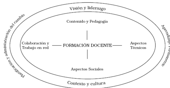
Figura 2: Las Tecnologías de la Información y la Comunicación en la Formación Docente (UNESCO,2004. p.46)

Al planificar la incorporación de las TIC a los programas de formación docente, se debe tomar en consideración una serie de factores necesarios para el éxito del programa. En el informe sobre las TIC y la formación docente elaborado por UNESCO (Figura 2) se presenta un marco conceptual holístico para ayudar a integrar las TIC en la formación docente.