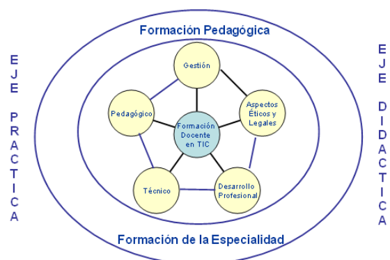
Figura 4: Elementos de la propuesta (Silva et al, 2006; Silva te al., 2008).

La propuesta se esquematiza en la siguiente figura: